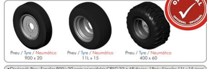
Pneu / Tyre / Neumático 900 x 20 Pneu / Tyre / Neumático 11L x 15 Pneu / Tyre / Neumático 400 x 60

•Standard: Rodeiro duplo com pneu 7.50x16 para os modelos CRSG 32 a 48 discos. •Standard: double ground wheel with tyre 7.50x16 for models CRSG from 32 to 48 blades. •Standard: Ruedas dobles con neumáticos 7.50x16 para los modelos CRSG 32-48 discos.