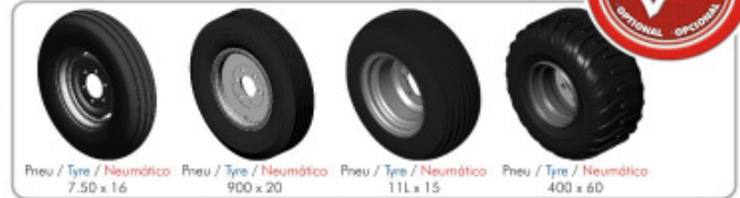
Pneu / Tyre / Neumático 7.50 x 16 Pneu / Tyre / Neumático 900 x 20 Pneu / Tyre / Neumático 11L x 15 Pneu / Tyre / Neumático 400 x 60