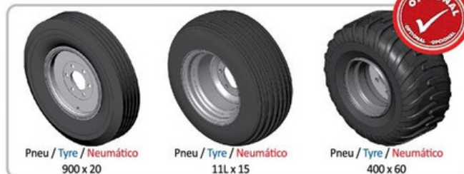
Pneu / Tyre / Neumático 900 x 20